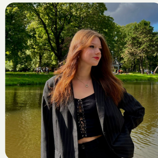
Ance Lepse Vadītājas vietniece