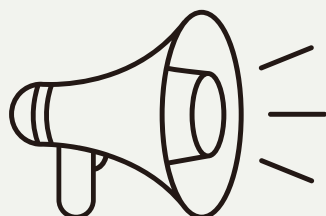
Sabiedrisko attiecību virziena vadītājs