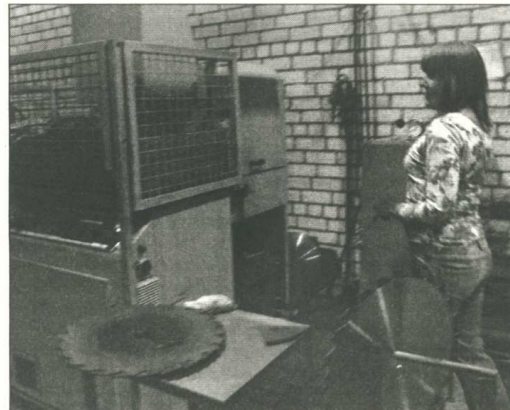
Uzņēmumā visi darbi neprasa fizisku piepūli, tie ir pa spēkam arī sievietēm

eksporta – uz Krieviju, Baltkrieviju (50 procenti), pārējais uz Lietuvu, Igauniju, Poliju, Vāciju, daļa (ap 20 procentiem) tiek realizēta Latvijā.