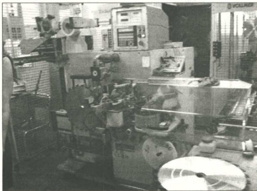
Pie šī darbgalda visus darbus paveic robots

Prakses laikā uzzināts daudz interesanta, kaut vai, kā reālajā dzīvē darbojas frēzmašīnas, lāzergriešanas iekārtas, kas itin viegli izgriez ļoti precīzu ripzāģi, kā tas tālāk tiek slīpēts un sagatavots un iepakots pārdošanai, kā ripzāģis virzās un mainās tā izskats un kvalitāte tehnoloģiskajos procesos no metāla gabala