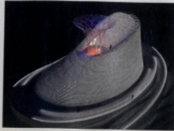
Vizualizācija topošajam Austra Mailiša projektam – Šaolin lidojošo mūku templim.

TEKSTS AGNESE KLEINA