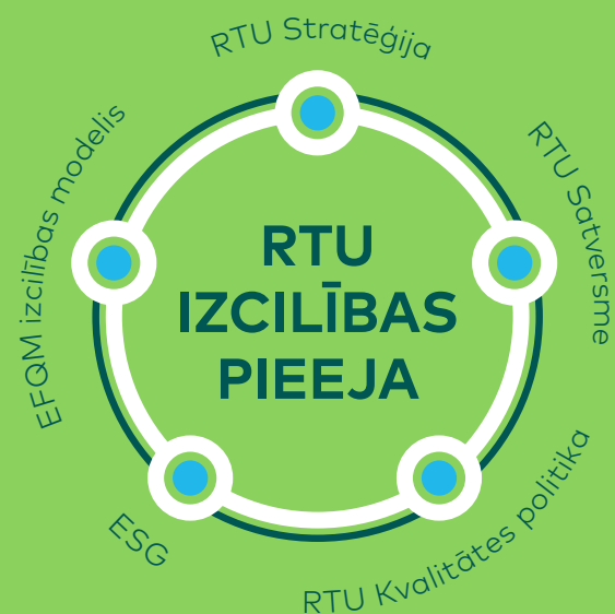
1. attēls. RTU Izcilības pieeja.

Ilgtermiņā attīstības un izcilības sasniegšanā īpaša uzmanība tiek pievērsta vadībai un līderībai, stratēģiskajai plānošanai, procesu pieejai, produktu un pakalpojumu attīstībai, finanšu plūsmas un finanšu rādītāju uzlabošanai, efektivitātes paaugstināšanai visās darbības jomās, studentu, sadarbības partneru un darbinieku apmierinātības veicināšanai un plašāka tirgus apgūšanai.